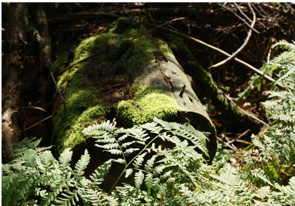
Puszcza Białowieska

Opracowały: Małgorzata Hajto i Paulina Legutko-Kobus